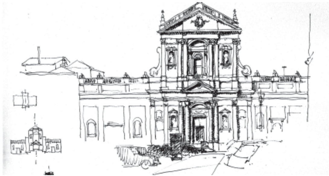
Roma, 16. 0.83 Santa Susanna