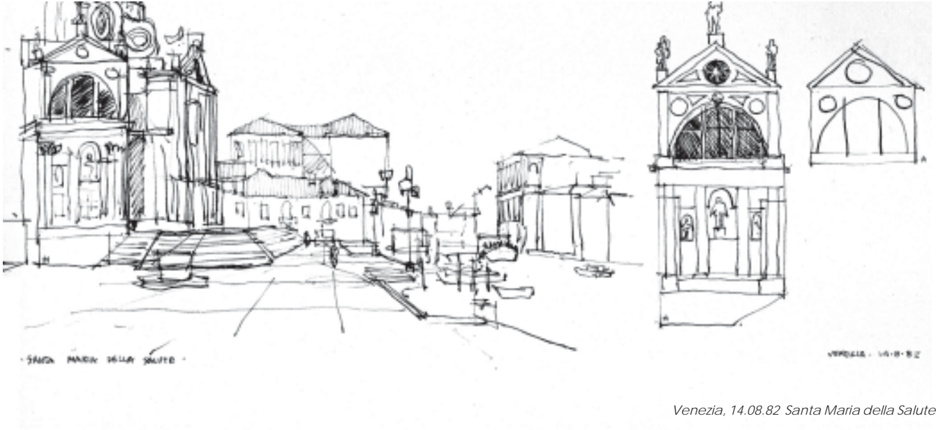
Venezia, 14.08.82 Santa Maria della Salute