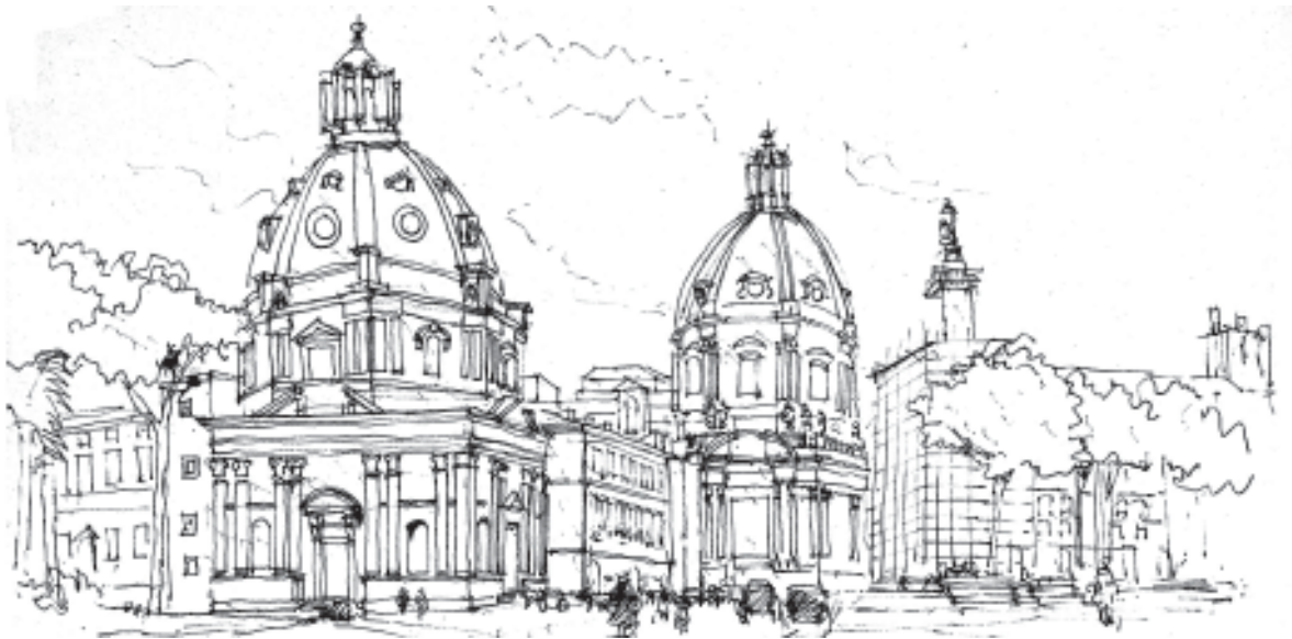
Roma, 13.03.83 Santa Maria di Loreto y Santissimo Nome di Maria

De esta manera viajó a Nueva Cork, Boston, Washington, París, Ámsterdam, Utrech, Stuttgart, Madrid, Barcelona, Córdova, Sevilla, Granada, Zagreb, Lubiana, Milán, Venecia, Siena, Mantova, Florencia, Oporto, Lisboa y otras tantas ciudades.