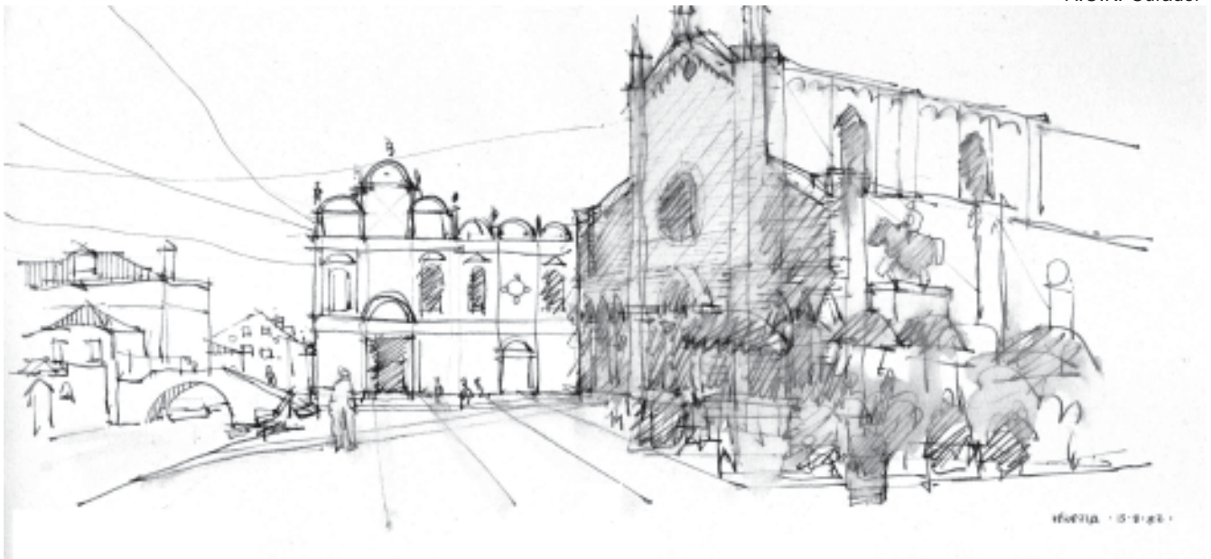
Venezia, 13.08.82 Ospedale San Giovanni e Paolo