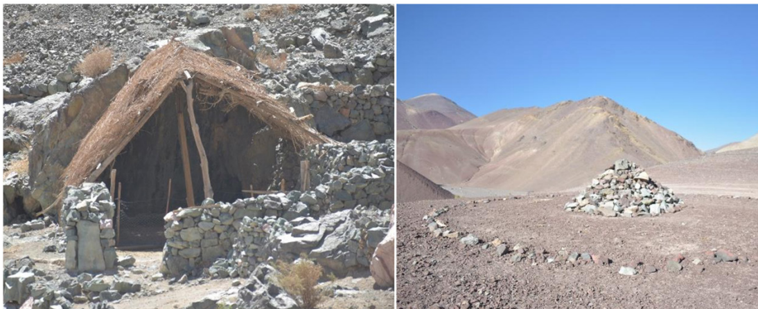
Figura 4. Construcción y sitio ceremonial de comunidad diaguita de Tierra Amarilla Figure 4. Construction and ceremonial site of the Diaguita community of Tierra Amarilla