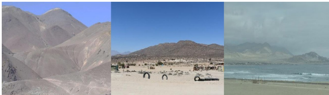
Figure 3. Mountain ranges of Tierra Amarilla, Vallenar Valley and Chañaral coast