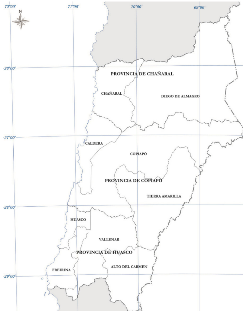
Figura 1. Mapa de la Región de Atacama por provincias y comunas Figure 1. Map of the Atacama Region by province and municipality