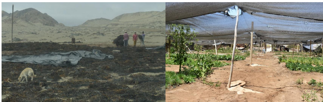
Figure 2. Artisanal fishing cove (Chañaral) and small-scale fruit and vegetable farm (Canto del Agua)