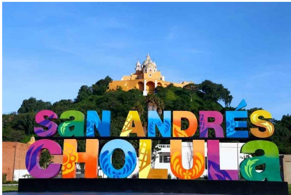
Figura 1. Iglesia de la Virgen de los Remedios en San Andrés Cholula Figure 1. Virgen de los Remedios church in San Andrés Cholula