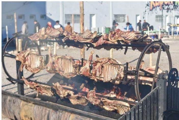
Figura 5. Asador tipo “spiedo” con capones, Keipon 2022. Figure 5. Roaster “spiedo” style with capones, Keipon 2022.