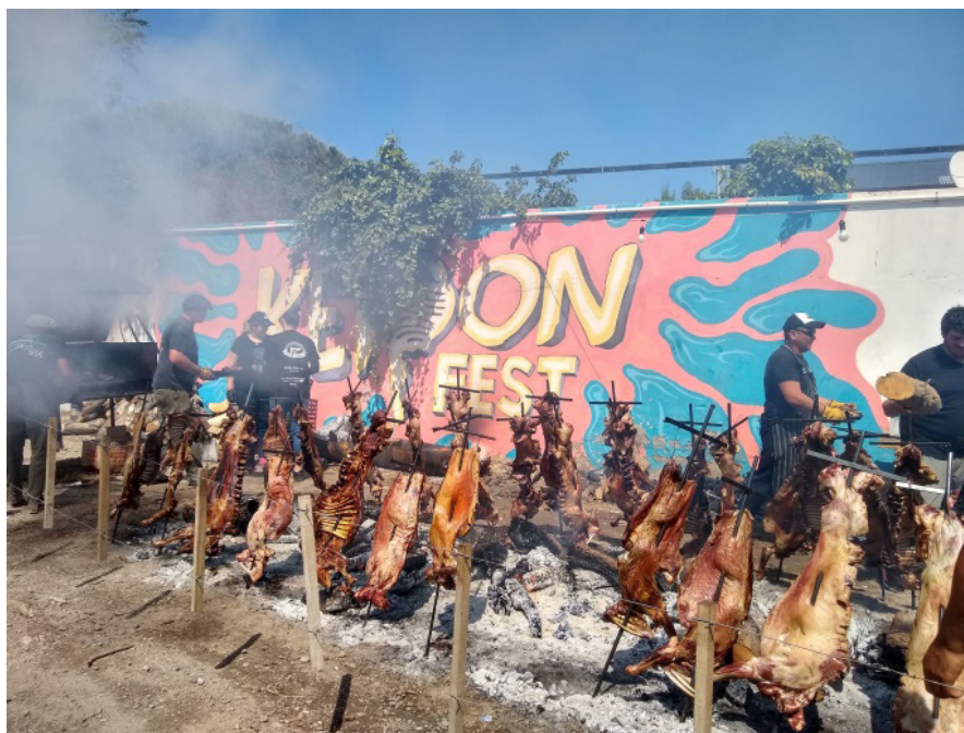
Figura 4. Asadores en la Keipon Fest 2023 Figure 4. Roasters in Keipon Fest 2023