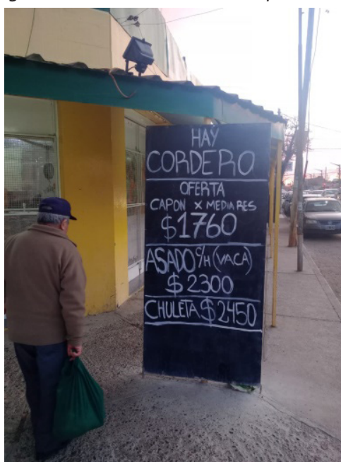
Figura 2. Pizarra de precios, carnicería en Trelew Figure 2. Price board, butcher shop in Trelew