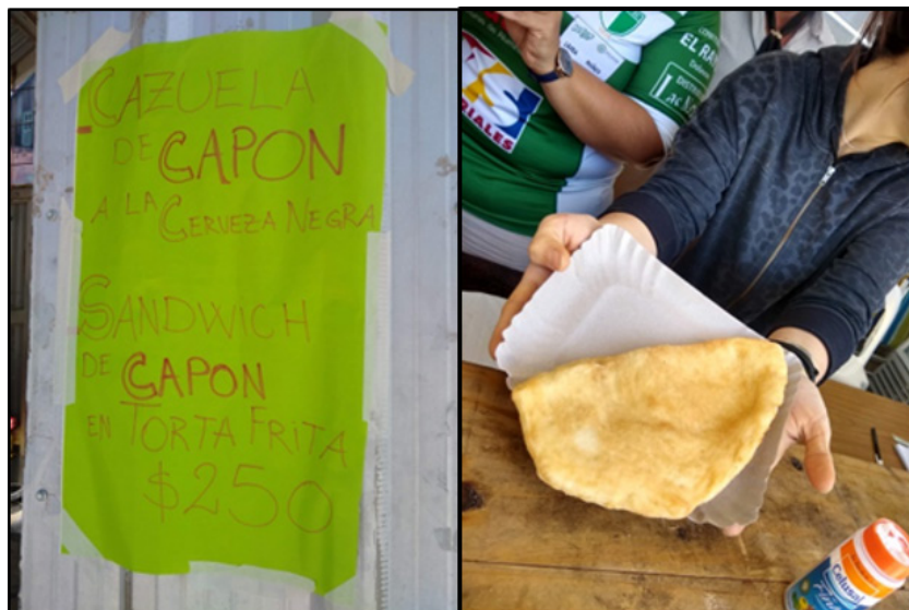
Figura 3. Oferta de comidas en un puesto de la fiesta y torta frita para sándwich sin relleno, Keipon 2022 Figure 3. Food offer at a party stand and fried cake for sandwich without filling, Keipon 2022