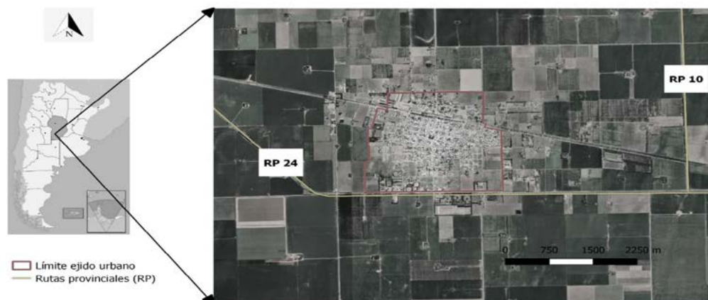
Figure 1. Location of Adelia María, Córdoba, Argentina