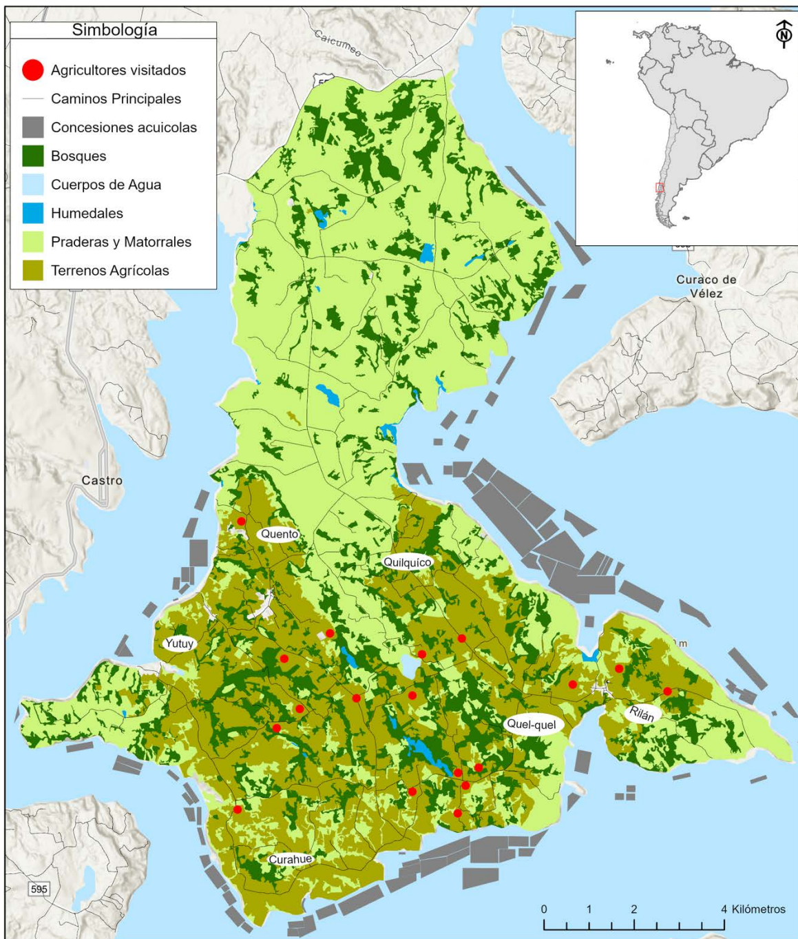
Figure 1. Mapping and location of the study area