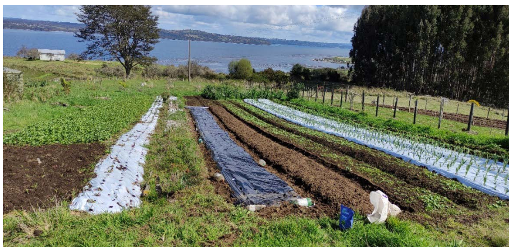
Figura 3. Paisaje rural de sector Quel-Quel: Entre lo agrícola y lo acuícola Figure 3. Rural landscape of Quel-Quel sector: Between agriculture and aquaculture