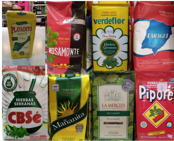
Figura 2. Presentaciones de yerba mate para su consumo Figure 2. Presentations of yerba mate for consumption