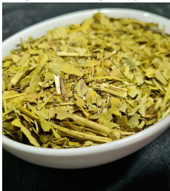
Figure 1. Yerba canchada prior to be ground