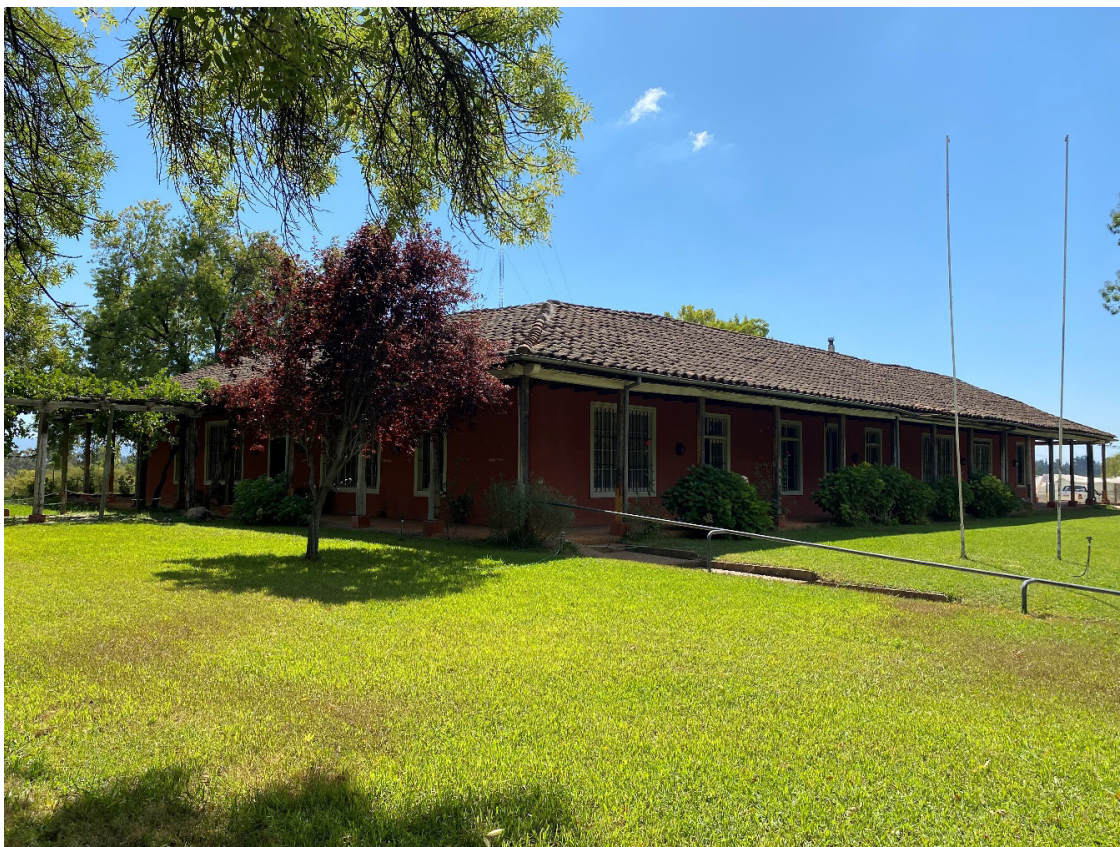
Figura 2. Vista de la casona que alberga las oficinas de la Estación Experimental Cauquenes Figure 2. View of the ancient building where Cauquenes Experimental Station research and administrative offices are located