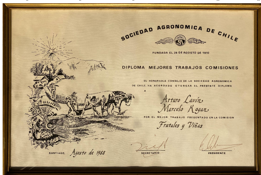
Figura 5. Premio al mejor trabajo de la Comisión frutales y viñas en el Congreso Agronómico 1988 Figure 5. Award for the best work of the Commission fruit trees and vines at the Agronomic Congress 1988