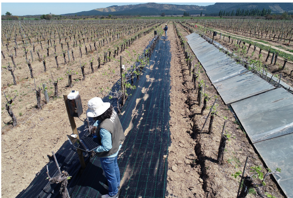
Figure 6. Study of the effect of the increase in temperature in a vineyard of the País variety, Caliboro, San Javier