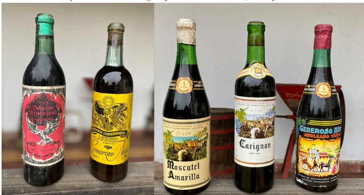
Figure 3. Old bottles made in EE Cauquenes facilities. From left to right: Terciopelo and Generoso Añejo y wines produced by CONFIN in the 1950s; Moscatel amarilla 1967/68, Carignan 1970 and Asoleado Tinto produced in 1966 and aged 4 years. The last three ones, made by INIA