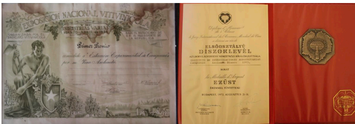
Figure 1. First award for the Asoleado wine Estación Vitivinícola Cauquenes at National Wine Fair in Santiago 1934 (left). Silver medal for the Asoleado Blanco wine INIA Cauquenes in the 1972 Budapest World Contest (right)