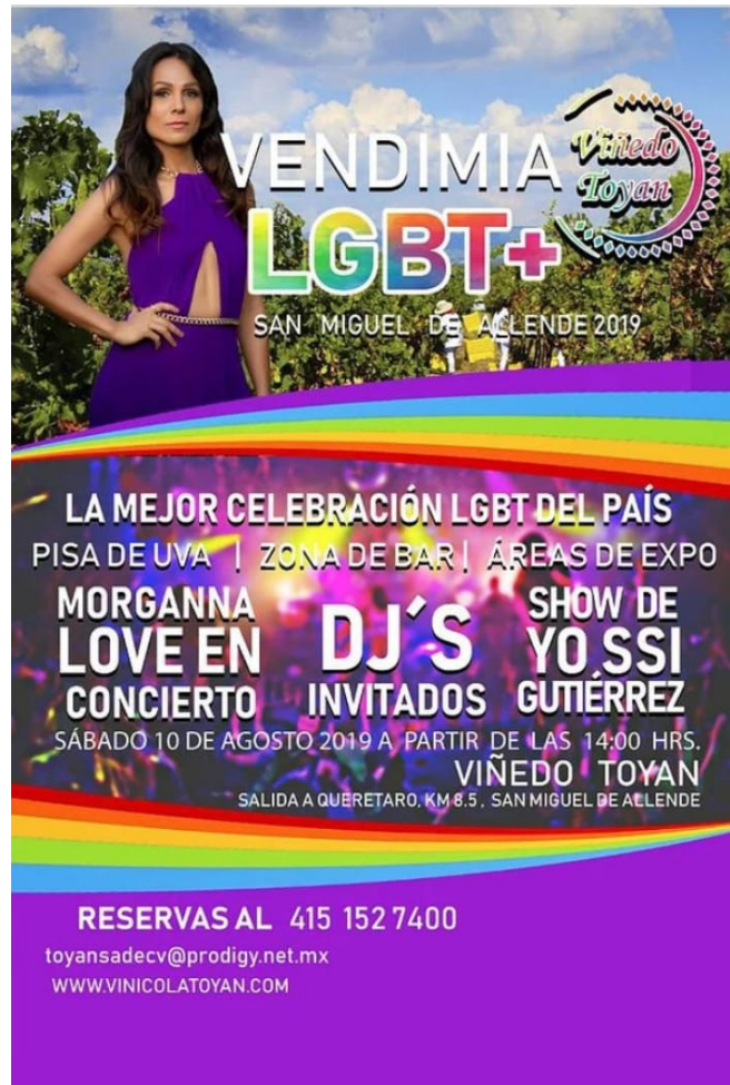
Figura 6. Vendimia LGBT+, Viñedos Toyan, San Miguel de Allende, México Figure 6. LGBT + Wine Festival, Toyan vineyards, San Miguel de Allende, Mexico

Ciertamente, las formas en que se van complejizando las expresiones de la vendimia en México parten de un principio organizador, basado en la hibridación cultural (García-Canclini, 1990). Sin embargo, ello solo es parte de una teatralización sofisticada que requiere múltiples elementos, tomados en préstamo de diversos grupos sociales que no necesariamente están invitados a la fiesta (Más de Acá, 2019), tal como certifican los precios de acceso a estos eventos, cuyo promedio oscila en cien dólares americanos, algo no permitido para la inmensa mayoría de habitantes.