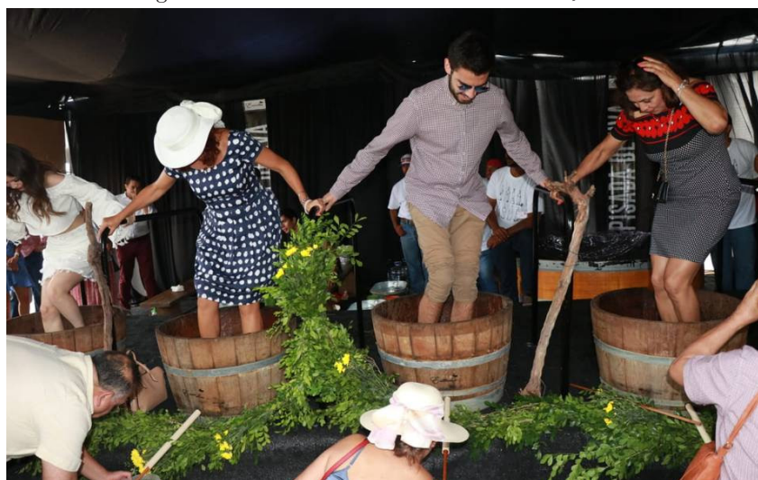
Figure 7. Harvest Festival Hacienda Encinillas, 2019