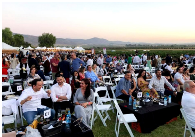
Figure 5. Vintage 2019 Monte Xanic