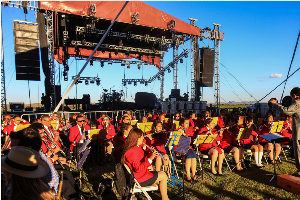
Figure 9. Tierra Adentro Wine Festival 2018