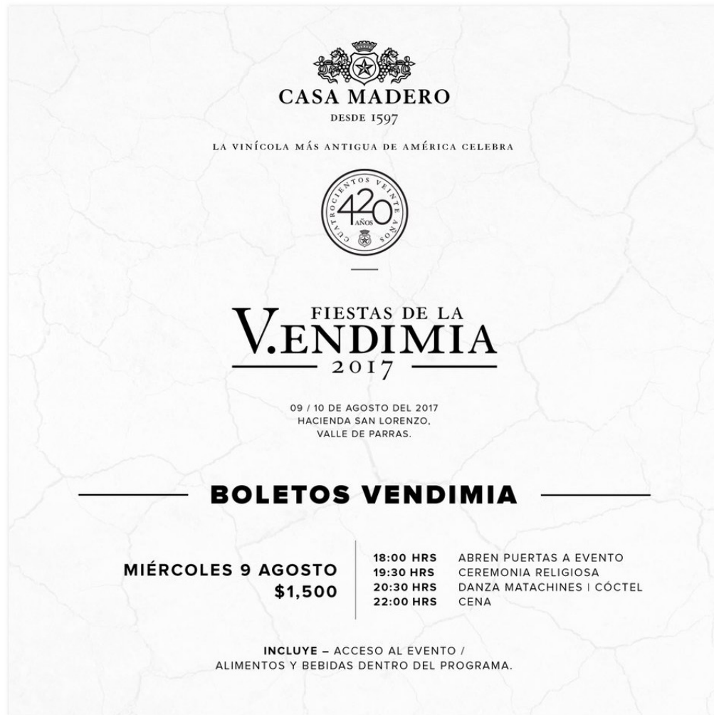
Figura 3. Evento privado en Vendimia Casa Madero, 2017 Figure 3. Private event at the Casa Madero Festival, 2017