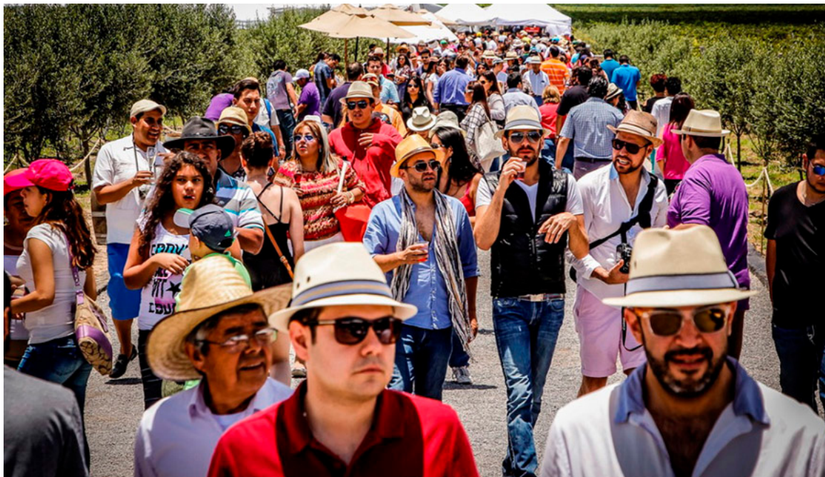
Figura 4. Vendimia 2015 Freixenet, Querétaro, México Figure 4. 2015 Freixenet Festival, Querétaro, Mexico