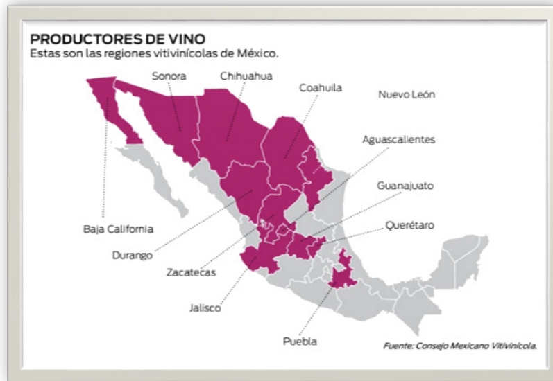
Figura 2. Regiones vitivinícolas de México Figure 2. Wine regions of Mexico