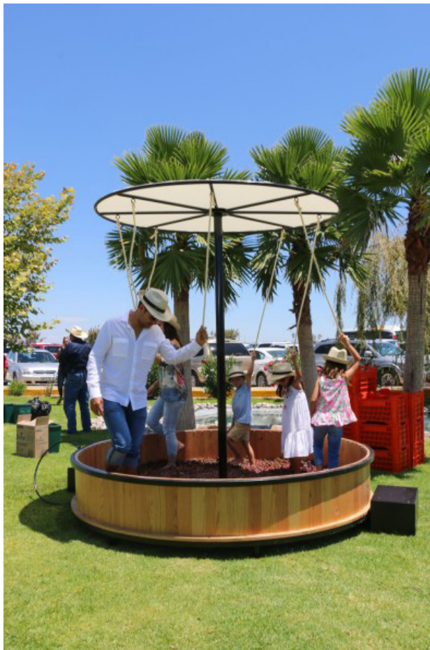
Figura 8. Vendimia Cava Quintanilla 2018 Figure 8. Cava Quintanilla Wine Festival, 2018