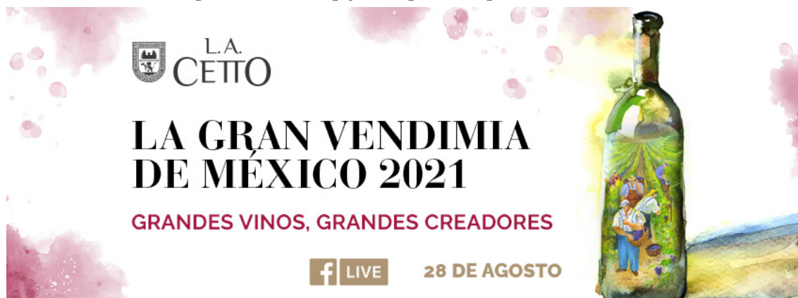
Figura 10. Publicidad de Vendimia Digital L.A. Cetto, 2021 Figure 10. Advertising of the Digital Vintage L.A. Cetto, 2021