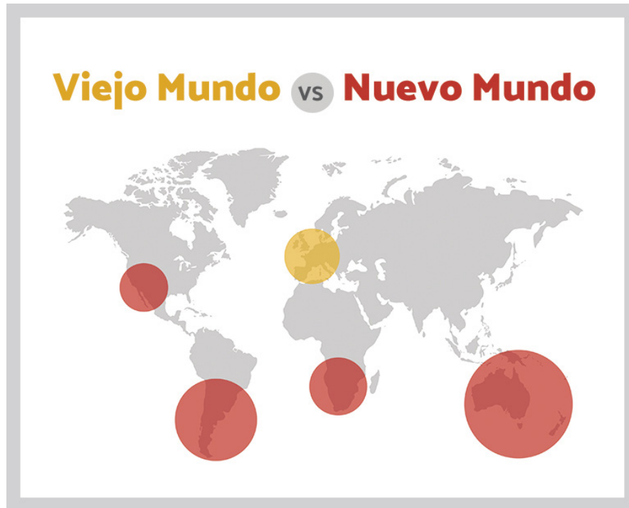
Figura 1. Nuevo y Viejo Mundo del Vino Figure 1. New and Old World of Wine