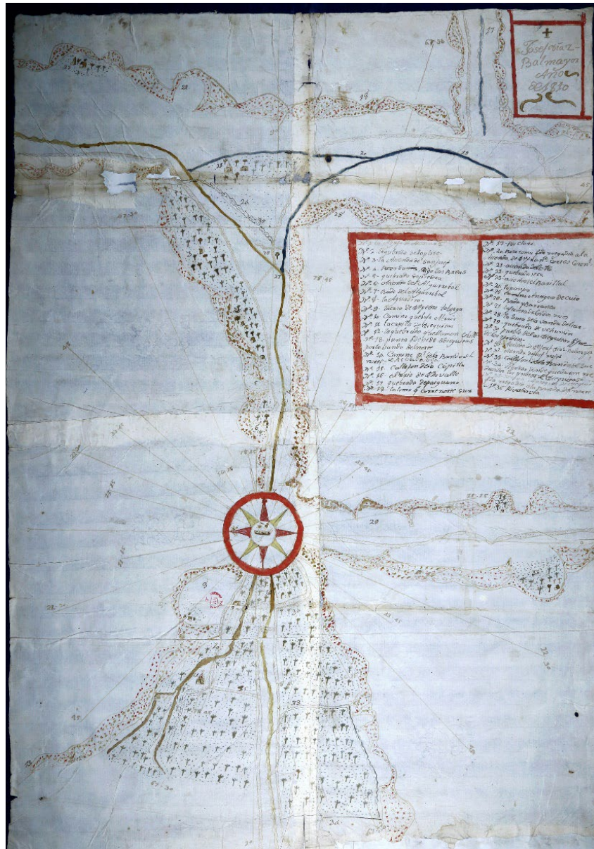
Figura 1. Mapa del valle de Elqui, 1810. José Díaz de Balmayor Figure 1. Elqui Valley map, 1810. José Díaz de Balmayor