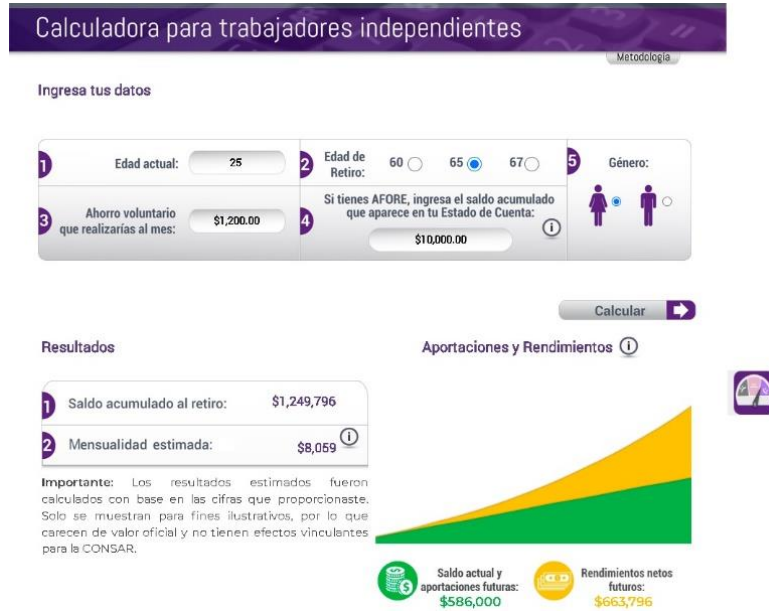
Figura N°10. Calculadora para trabajadores independientes.