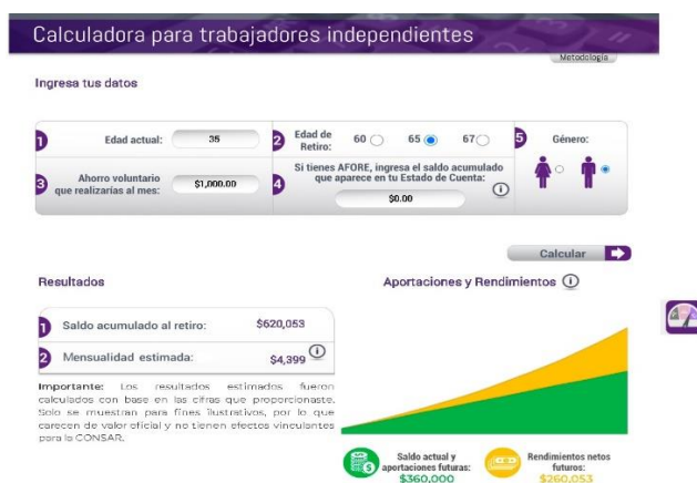
Figura N°9. Calculadora para trabajadores independientes.