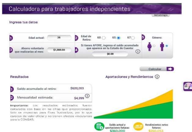
Figura N°9. Calculadora para trabajadores independientes.