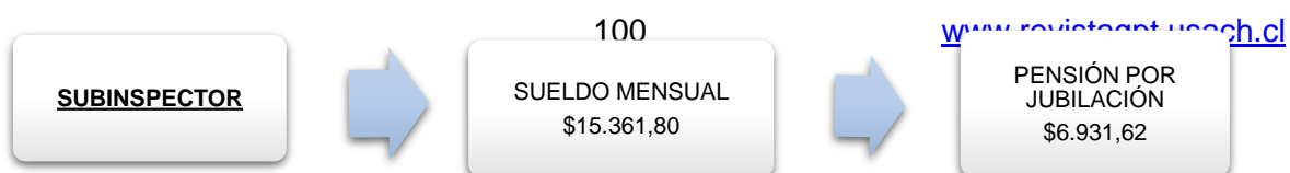
Figura N°7. Sueldo y Pensión de un elemento de la SSP con categoría de SUBINSPECTOR

El pago de la pensión por jubilación se hará por la cantidad equivalente al cien por ciento del sueldo regulador, alguien podría pensar que en el primer caso la pensión por jubilación (la cual es mensual) sería de $15.361,80 mensuales, sin embargo, no es así, de acuerdo a la Ley del IPE al establecer el cien por ciento del sueldo como pago de pensión por jubilación, no se refiere al sueldo y las demás percepciones, sino única y exclusivamente al pago del SUELDO, ver Figura N°7 y Figura N°8 .