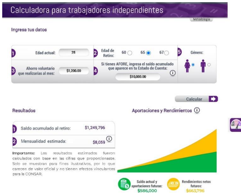
Figura N°10. Calculadora para trabajadores independientes.