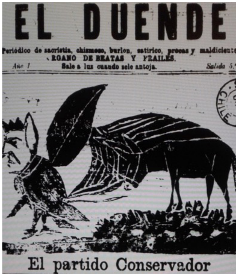
Figura 7. «El partido Conservador» Figure 7. “The Conservative Party”

Fuente: portada de El Duende , año 1 número 5, 1893. Santiago, Colección Biblioteca Nacional de Chile. Source: cover of El Duende , year 1 number 5, 1893. Santiago, Biblioteca Nacional de Chile Collection.