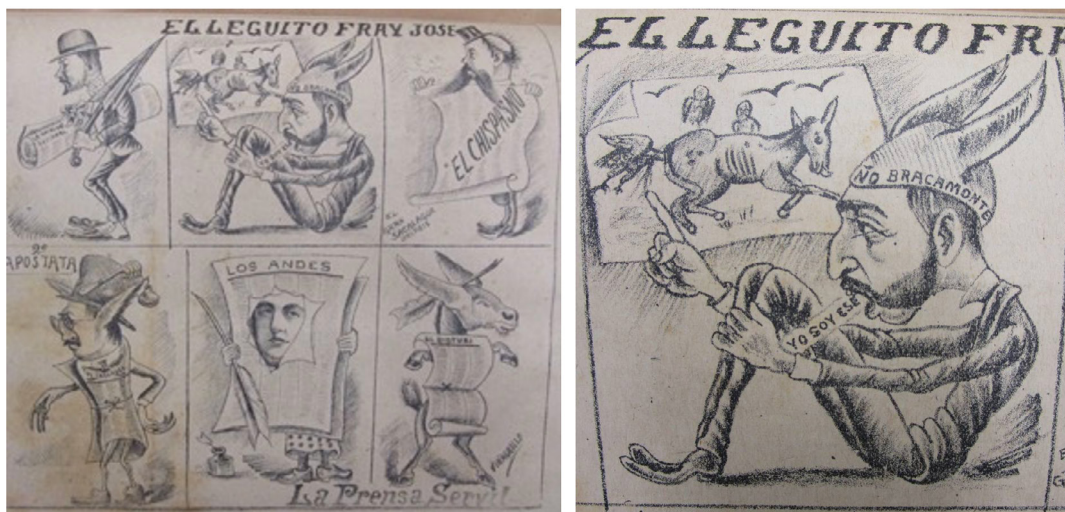
Figura 9. «La prensa servil», por Vinagrillo Figure 9. “The servile press”, by Vinagrillo