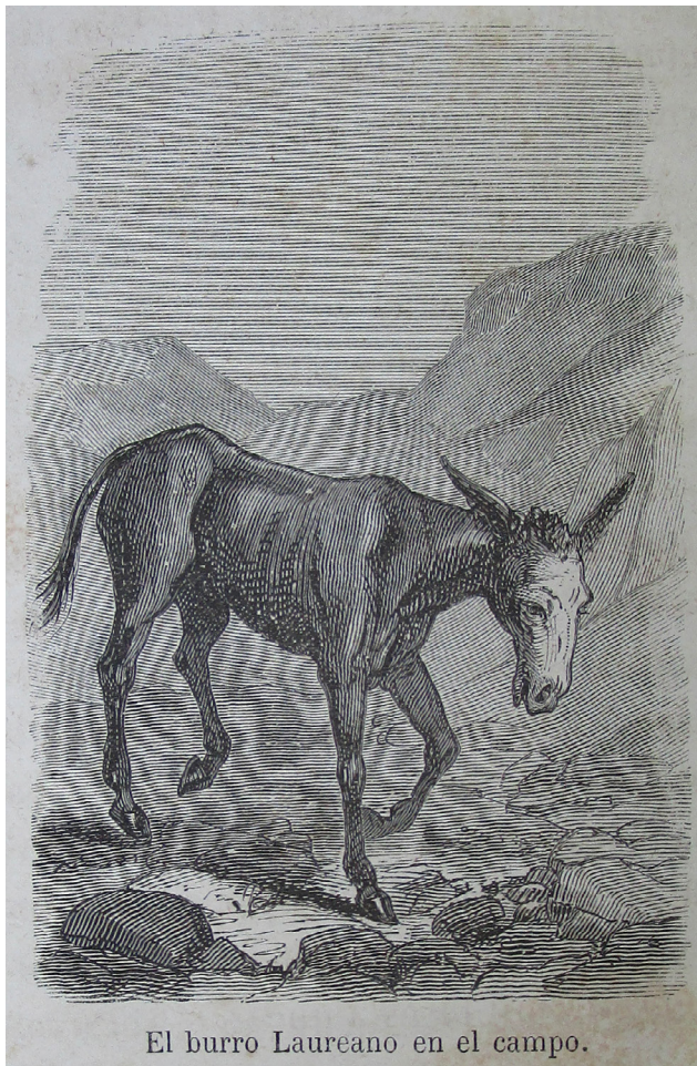
El burro Laureano en el campo.