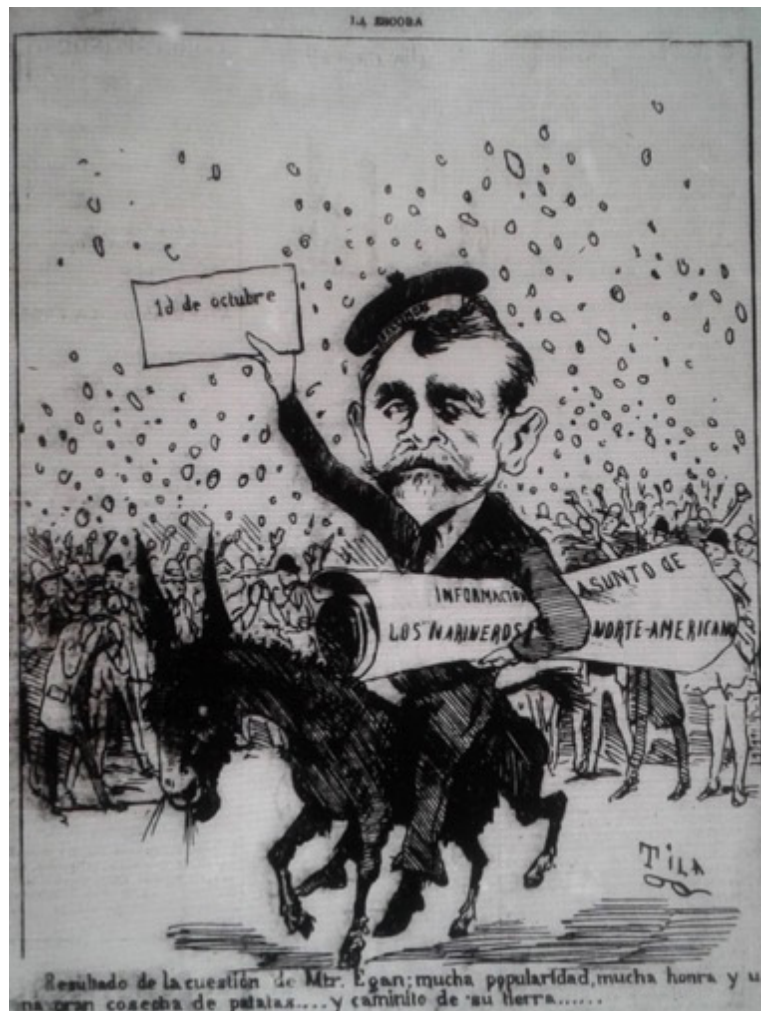
Figura 5. Tila Figure 5. Tila