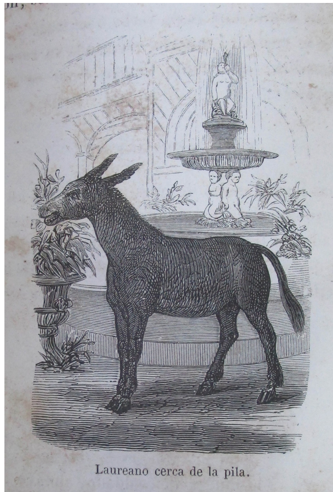
Figura 2. «Laureano cerca de la pila» Figure 2. "Laureano near the water pool"