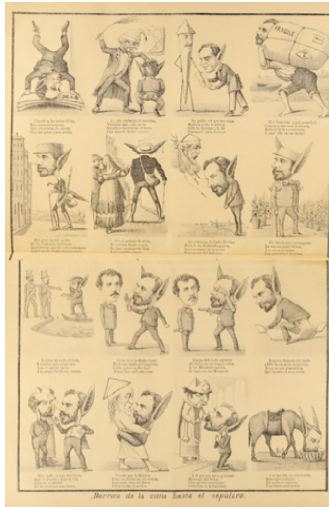
Figura 6. «Borrusco de la cuna hasta el sepulcro», litografía a dos planas Figure 6. "Donkey from the cradle to the grave", two-panel lithograph