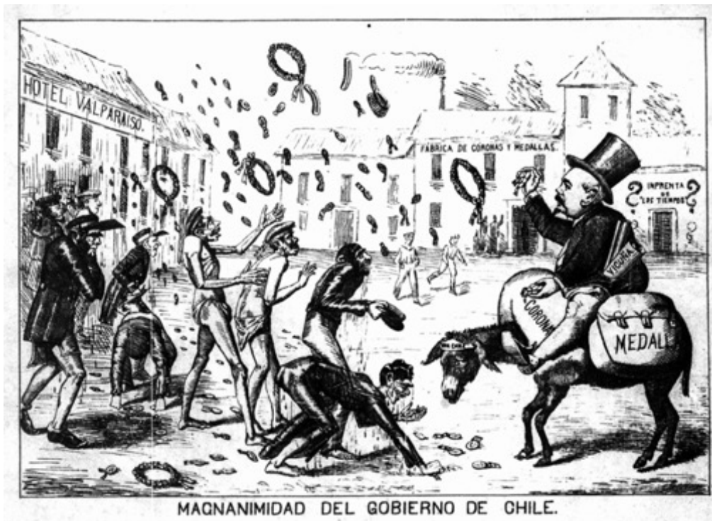
Figura 11. «Magnanimidad del gobierno de Chile», por Enrique Bressler Figure 11. «Magnanimity of the Chilean government Chile», by Enrique Bressler