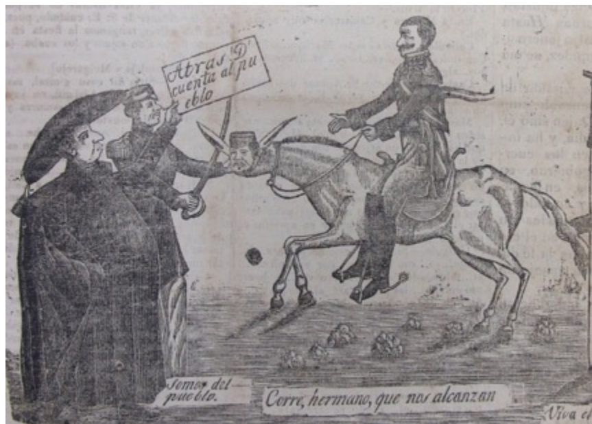
Figura 4. Frontispicio de La Zamacueca Política Figure 4. Frontispiece of La Zamacueca política