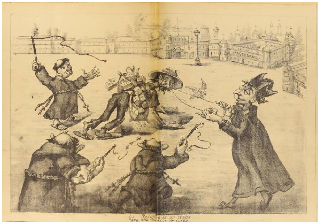
Figura 10. «La relijion es un freno para una bestia de carga», litografía a dos planas Figure 10. "Religion is a brake on a beat of burden", two-panel lithograph