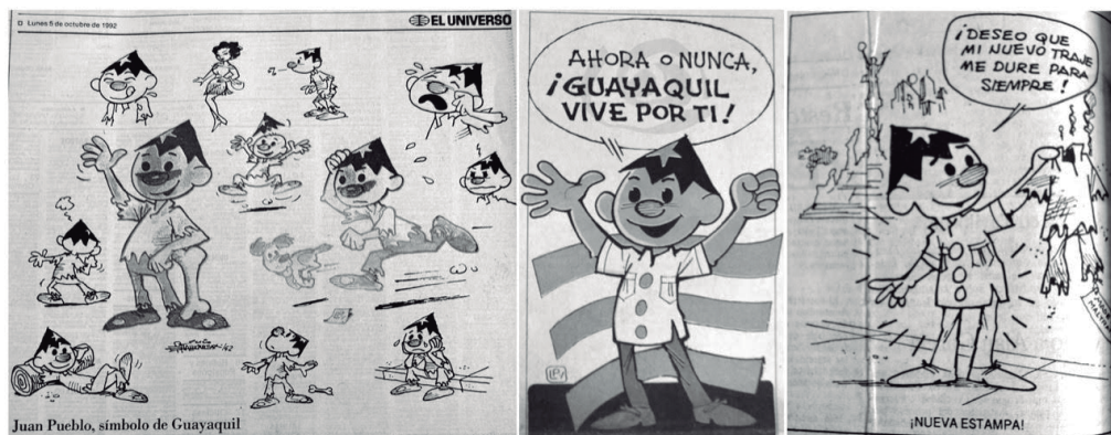
Imagen 2: Publicaciones de prensa que recogen la transformación de la figura de Juan Pueblo