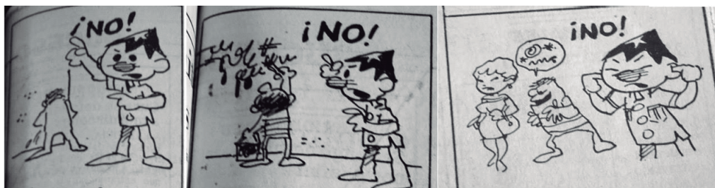
Imagen 3: Caricaturas de Juan Pueblo con mensajes sobre los comportamientos inadecuados en el espacio público