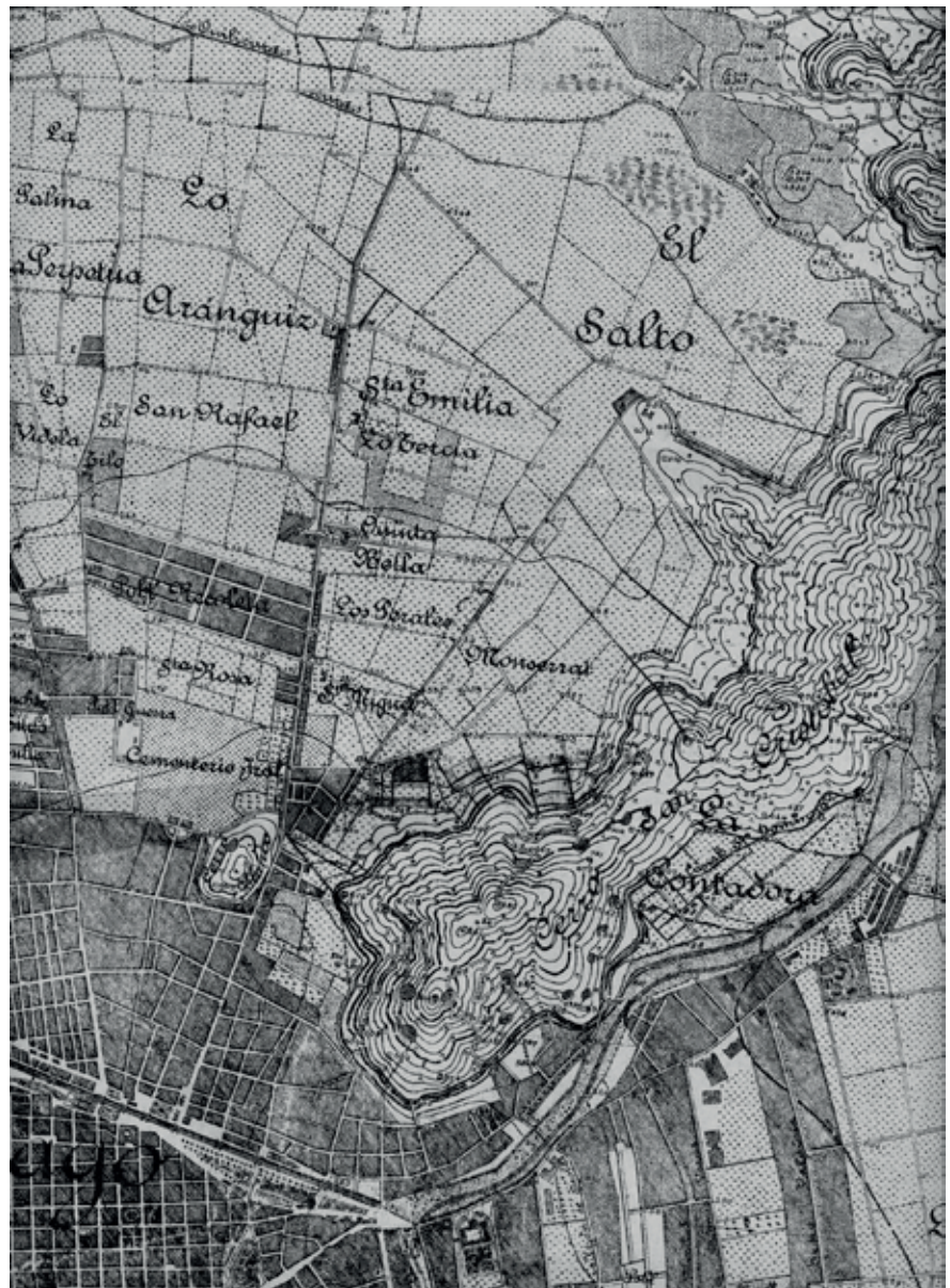
Figura 3: Estructura del espacio rural de la comuna de Recoleta IGM, 1928.