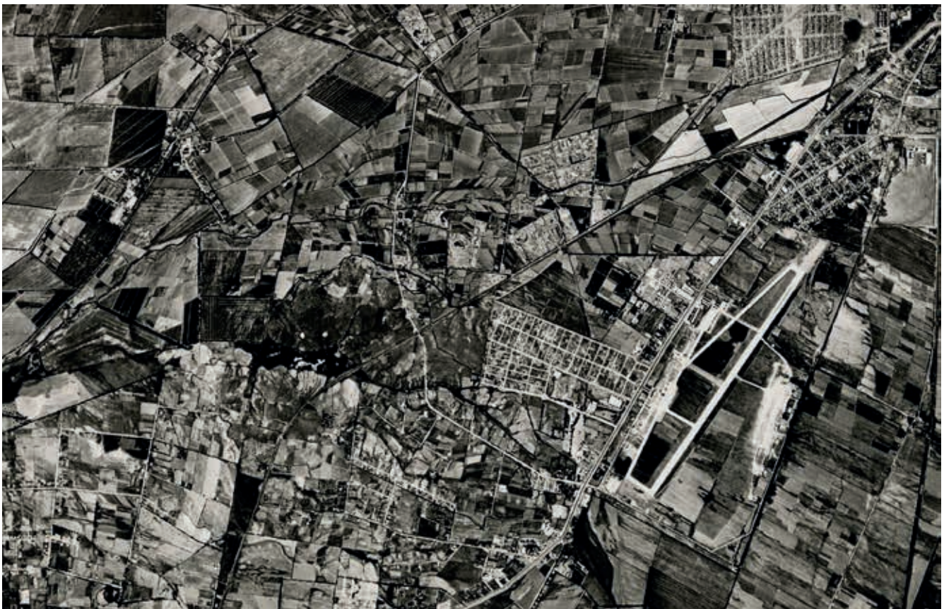
Figura 2: Traza urbana sobrepuesta sobre la traza agrícola IGM, 1954

Hay tanto potrero bajando por las calles sacras, que a nadie le importa quiénes se hacen dueños de las tierras que las aguas transforman en huertos y viñedos. De allí en adelante, la especulación se encarga de poner las vías para un crecimiento que aún no se detiene, cubriendo el valle de casas y calles. Si las aguas abren el suelo para transformarlo en un objeto productivo y de consumo inmobiliario, aún queda pendiente su valoración como un elemento participante en las nuevas configuraciones urbanas. Aun se encuentran pendientes sus aportes para definir los usos idóneos de suelo, de sus cualidades ambientales,