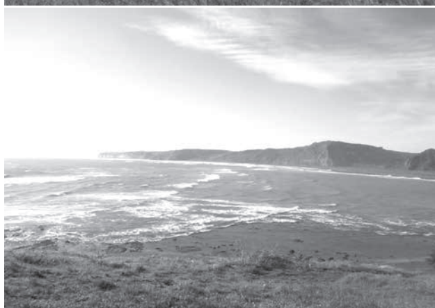
Navidad, VI región de Chile.