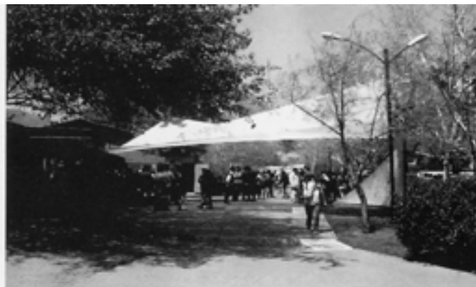
Lugar de los eventos. Espacio público de congregación ciudadana.