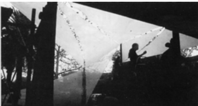
Patio urbano. Espacio de acontecer y significados múltiples.