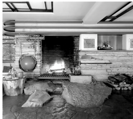
Figura 9. Casa Kauffmann, F.L.Wright. Recuperado de: https://www.archweb.it/dwg/arch_arredi_famosi/f_l_wright/Fa-llingwater/photo_interior/index.htm

minimalista, en la búsqueda de elementos encaminados a la tranquilidad y a la sencillez, en respuesta a la confusión y los problemas críticos y complejos de la sociedad moderna actual.