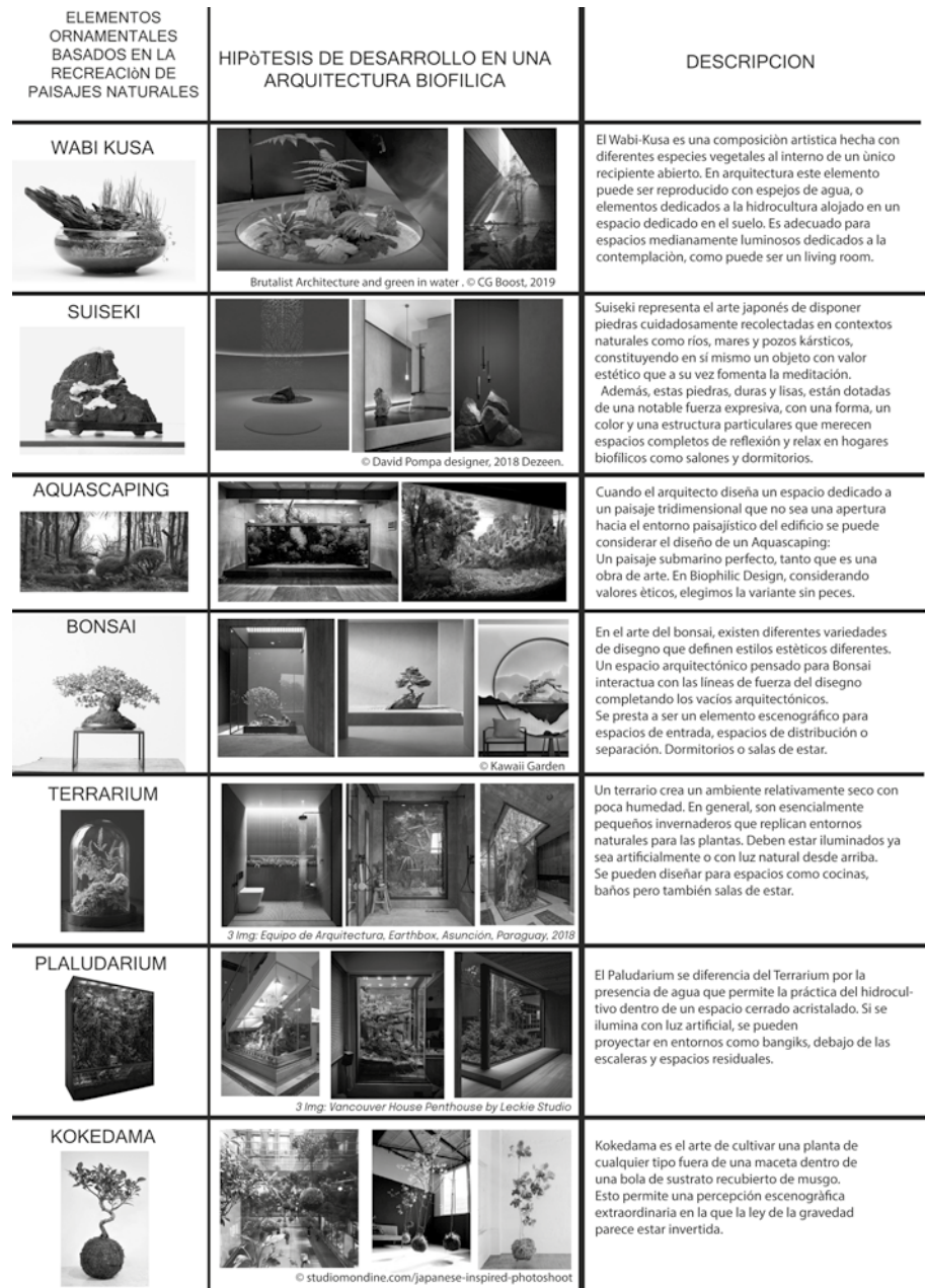
Tabla 2. La tabla enumera composiciones japoneses de paisajes naturales en miniatura, con una propuesta de los autores para su inclusión en el contexto arquitectónico interno en la columna adyacente. Se aprecian espacios minimalistas y plásticos, volúmenes en piedra natural pulida, donde se estudia la luz para potenciar los vacíos y la composición vegetal.

Según la Enciclopedia Británica, los primeros cultivos de interior se remontan a la época de los antiguos griegos y romanos que, si bien no utilizaban las plantas como decoración de interiores, las cultivaban en macetas. El nacimiento de los jardines, tanto en Occidente como en Oriente, siempre ha estado ligado a la necesidad que tiene el hombre de relacionarse con su ecosistema. Fue en el siglo XVII cuando se le dio mucha importancia a la idea de cultivar plantas en interiores: el experto en agricultura inglés H. Plat escribió por primera vez (Plat, 1652) sobre esta posibilidad, lo que provocó la construcción de invernaderos en toda Inglaterra. Estas estructuras se utilizaron para cultivar, mantener y disfrutar de las plantas tropicales que fueron traídas en los viajes de Colón al "nuevo" mundo. Las plantas de interior se hicieron increíblemente populares a mediados y finales del siglo XIX en Inglaterra. En relación con la vegetación que rodea y complementa al edificio los patios, el parrón, la pérgola, han sido un nexo entre el exterior y el interior, entre la naturaleza y el arteificio. A lo largo de la historia siempre han representado entre los climas más