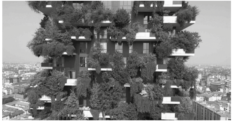
Figura 5. Bosque Vertical del Estudio Boeri en Tirana © Studio Boeri. Recuperado de: https://www.stefanoberichitetti.net/project/bosco-verticale/

estudio de la neurociencia, investiga el comportamiento humano a través del espacio y del diseño de espacios interiores. El "Diseño biofílico", por su parte, se ocupa de comprender cómo las conexiones entre los entornos naturales y construidos, se relacionan con una sensación de rehabi-