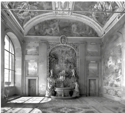
Figura 8. Sala Ercole Palazzo Farnese.