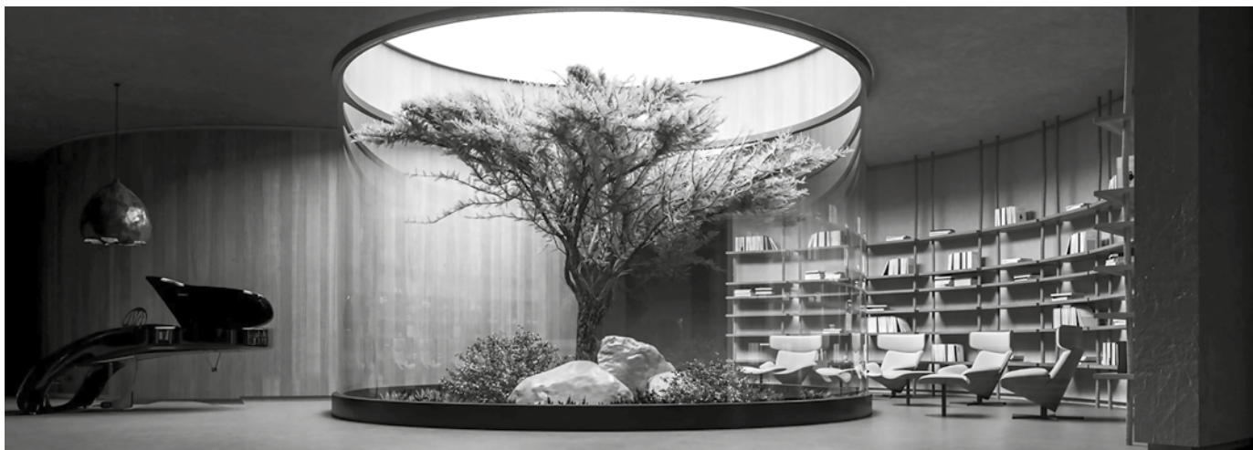
Figura 1. Repensando la vida post pandemia de COVID-19, Sergey Makhno Architects ha presentado el 'plan B', un innovador concepto de casa subterránea.