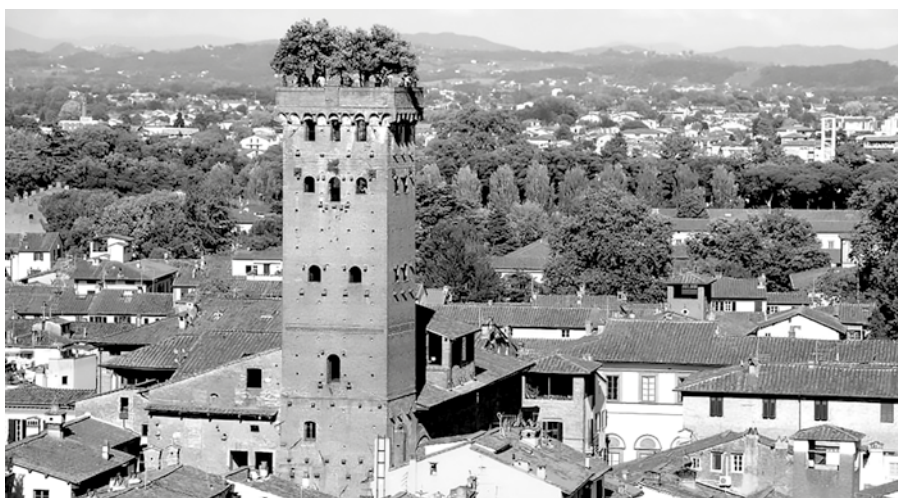
Figura 2 Guinigi Torre, en la ciudad de Lucca, Italia.

A favor de las interacciones sociales han evolucionado en las últimas décadas innumerables otras ramificaciones de la arquitectura como el diseño social, el diseño universal y, basado en elementos de una matriz fenomenológica, también el Evidence based-Design. El encuentro entre la Psicología Ambiental y la Arquitectura ha concebido una nueva figura profesional, la del arquitecto-psicólogo: un especialista en psicología arquitectónica; aquel que tiene un conocimiento más profundo sobre la psicología del habitar y que, a través del