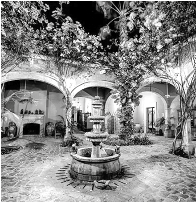
Figura 10. El patio Mexicano