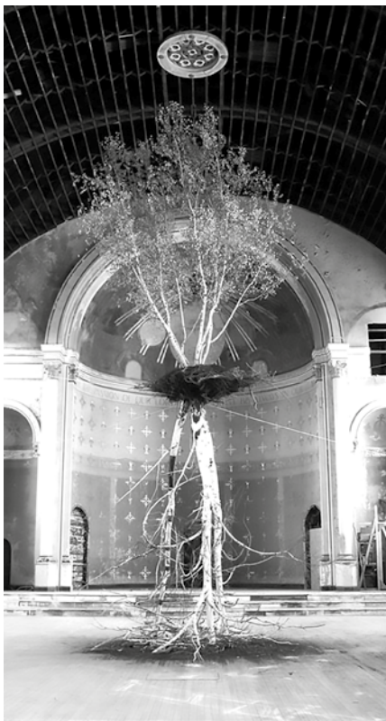
Figura 6. © Shinji Turner Yamamoto. Recuperado de: https://www.turneryamamoto.net/

De hecho, el diseño y la planificación han evolucionado hacia una pureza formal y