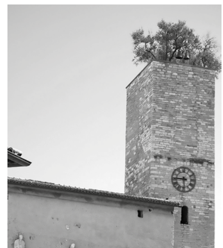
Figura 3. Torre en la ciudad de Spello, Italia.