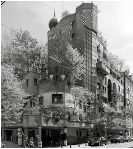
Figura 4. Hundertwasser, Viena.