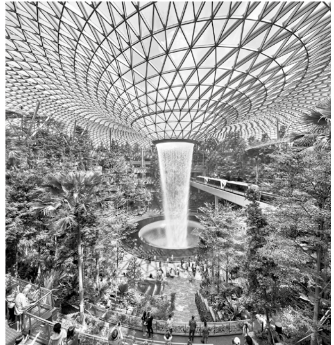
Figura 11. Singapur aeropuerto.

de que en la primera década del 2000 haya alcanzado un índice extremadamente alto de contaminación (Figura 11).