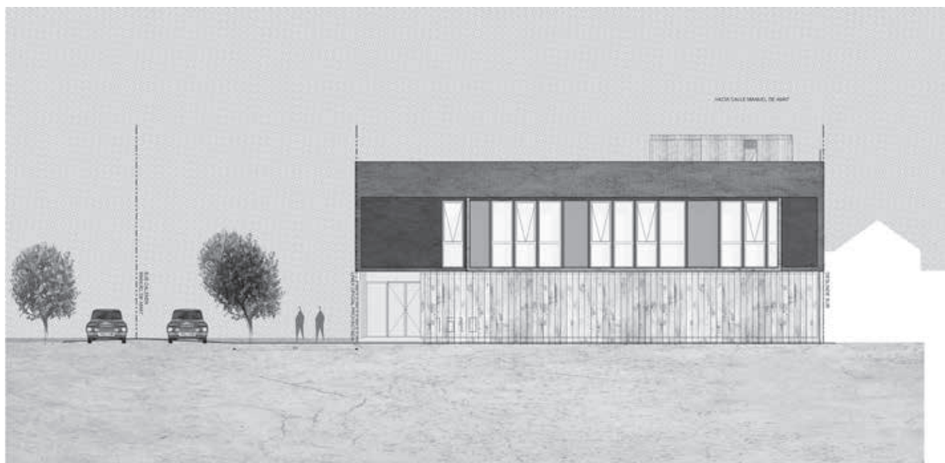
Figura 6. Elevación poniente.