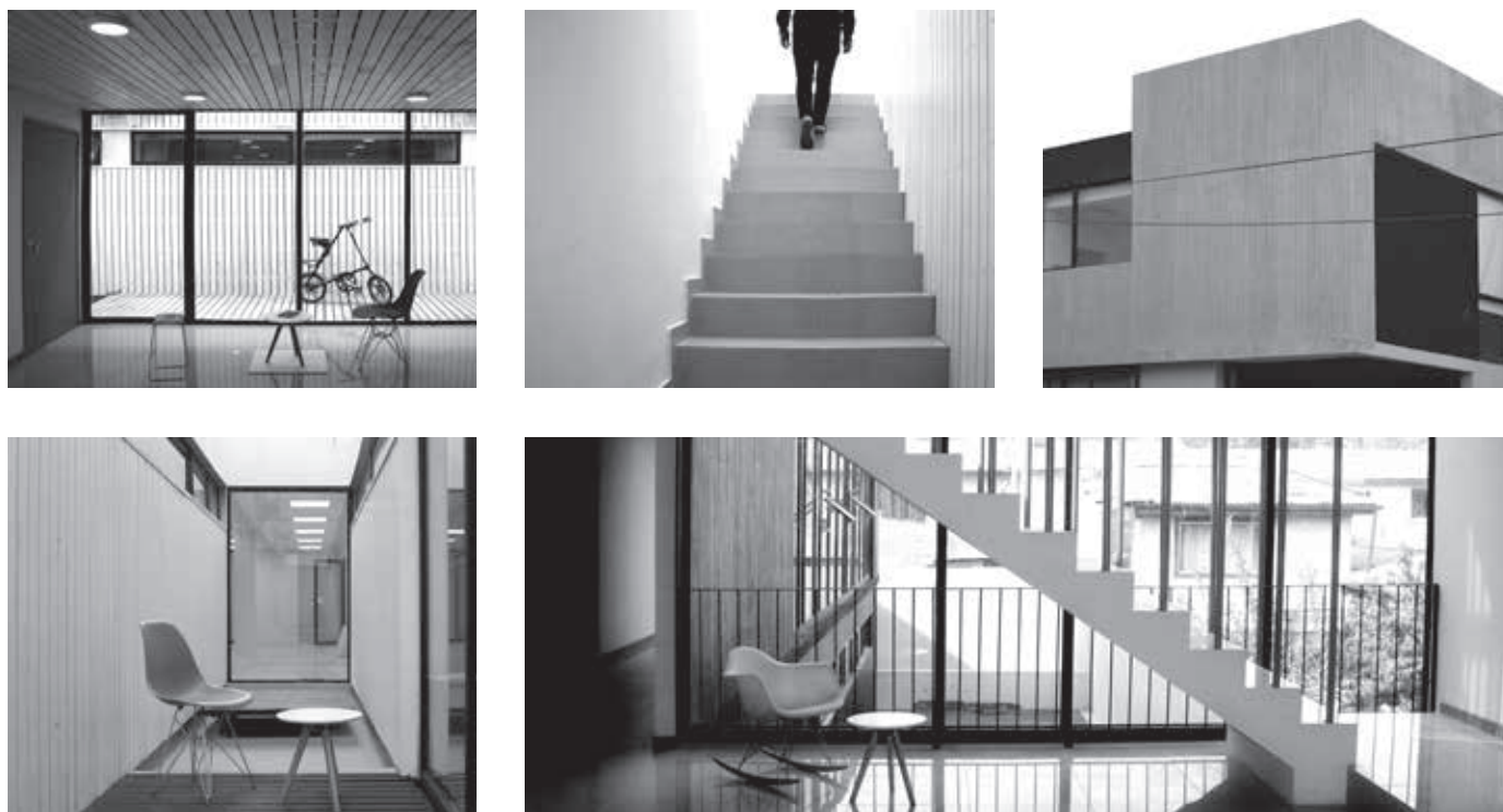
Figura 2. Vistas interior/exterior de la obra terminada.

alturas y proporciones, respetando la ciudad y las prácticas que ella ha acumulado a través del tiempo.