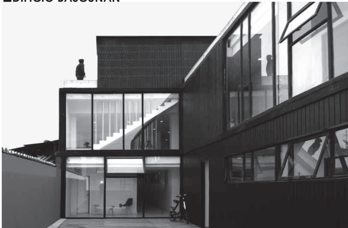
Figura 1. Vista desde patio interior.