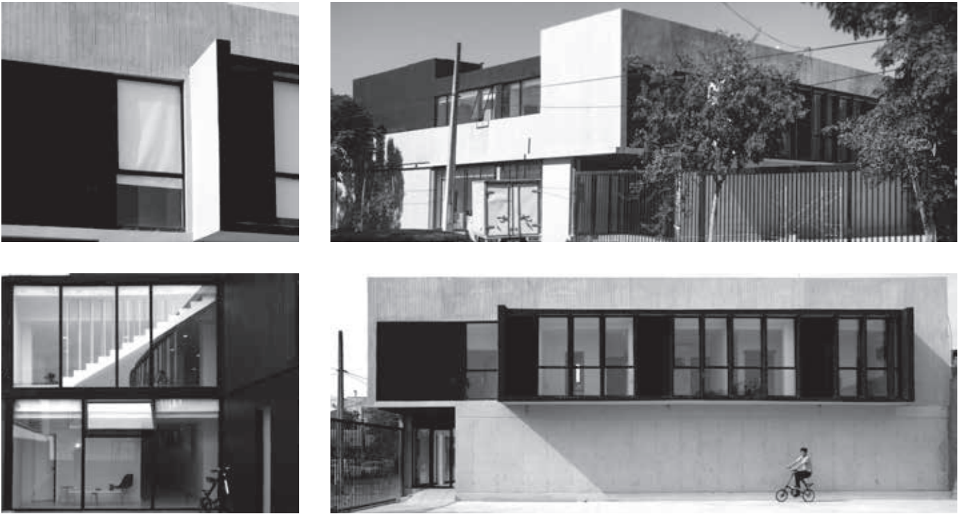
Figura 3. Vistas interior/exterior de la obra terminada.