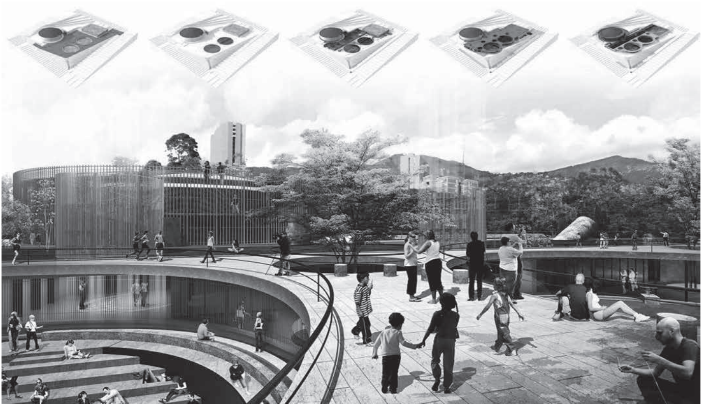
Figura 3. Estanques de agua como parque públicos, Medellín (Colombia).

se construyen barrios enteros. Aunque el término informal sea el atributo más usado para diferenciar la ciudad no planificada, hoy en día dicho término es rechazado porque implica una falta de forma que no pertenece a ninguna de otras expresiones conocidas. Como afirma Betaille, informal designa aquello que no tiene derechos de hacerse respetar, el elemento más débil del sistema dialectico formal/informal, donde lo visible existe gracias a al vacío que exalta el entorno construido y lo llena de significado. Más que de definiciones correctas, lo informal necesita de un reconocimiento oficial, como forma típica de asentamiento del siglo XX, emblema de una típica población proactiva que inicia procedimientos socio-económicos para lograr la autonomía negada por ser incompatible con las políticas habitacionales. La informalidad es la modalidad típica de urbanización metropolitana de Iberoamérica (Roy, 2005) en donde representa el fenómeno social más significativo del siglo XX. En las mismas décadas, la urbanización masiva conforma las grandes capitales de Europa y América, pero las diferencias sustanciales con Latinoamérica radican