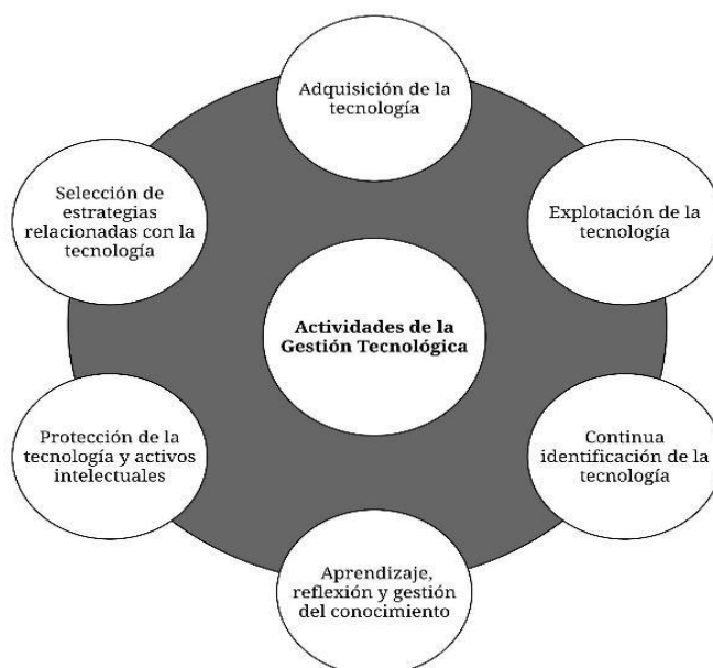
Figura 1. Actividades de la Gestión Tecnológica.