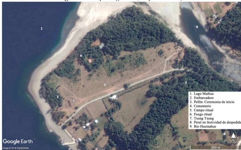
Figura 4. Campo de guillatun , Rupumeika Bajo