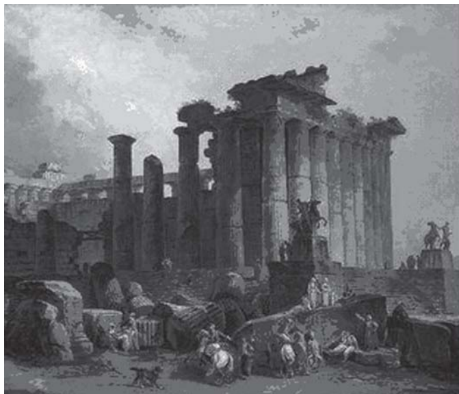
Hubert Robert, ruinas de un templo dórico