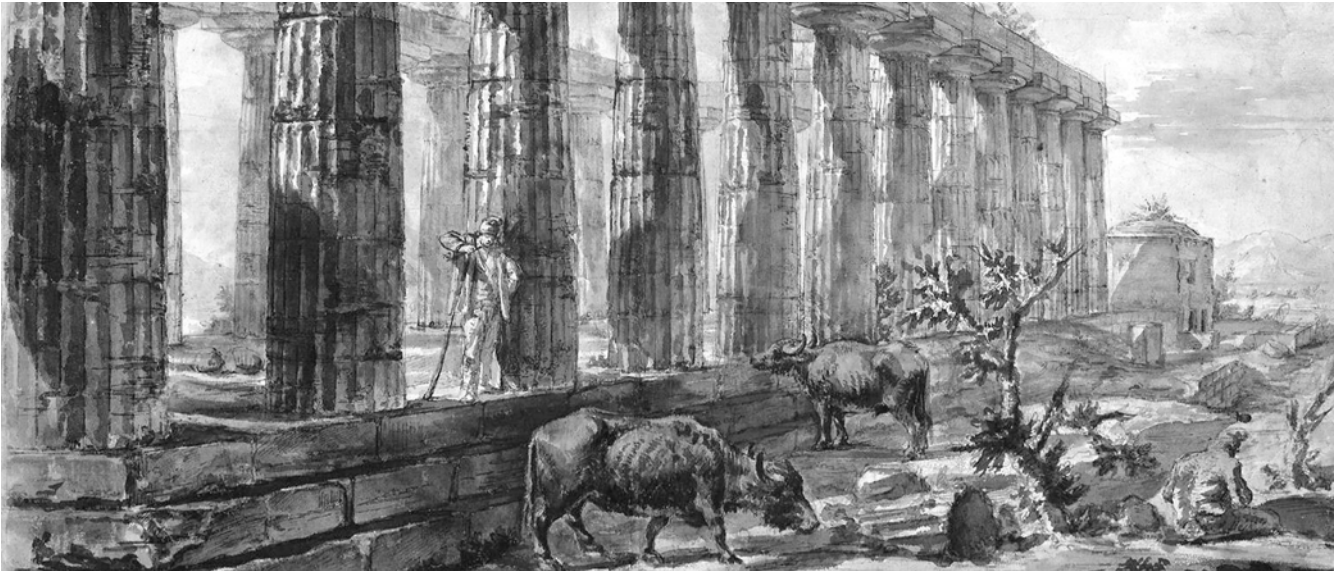
Piranesi, Templo en Pasteum

Hubert Robert. La loro immagine delle rovine rende visivamente il contrasto tra la maestà delle opere umane e la fragilità delle stesse di fronte all'incalzare del tempo. La natura appare come una forza devastante e distruttiva che agisce indifferentemente sull'uomo e sulle cose. I suoi cicli di distruzione e rigenerazione della materia non sembrano tener conto del bisogno di continuità della memoria umana. Per questo motivo entrambi trasfigurano tutta la pomposità monumentale delle vestigia antiche, consci tuttavia che la loro grandiosità porta con sé il fascino di un mondo perduto e caduto ormai in rovina. Piranesi ha il gusto per le rovine, i sepolcri, il passato leggendario della civiltà e l'aspirazione a farlo rivivere e anche per l'alone di malinconia che circonda le rovine; per questo si diverte nel crearne di nuove dove la figura umana è sempre presente e non aliena dalle rovine stesse, ma si coniuga con esse, le vive, le abita, le fa sue. Ne viene fuori un'immagine di Roma quasi spettrale, quasi città fantasma, non già perché priva di vita, ma perché immagine decaduta di quello che un tempo essa fu 1 . In quanto la rovina attesta la resistenza dell'umano, ci si potrebbe azzardare a dire che l'opera degradata non debba essere rinnovata; è proprio da qui che parte la polemica tra gli amministratori dei beni culturali che si avrà sino ai giorni nostri.