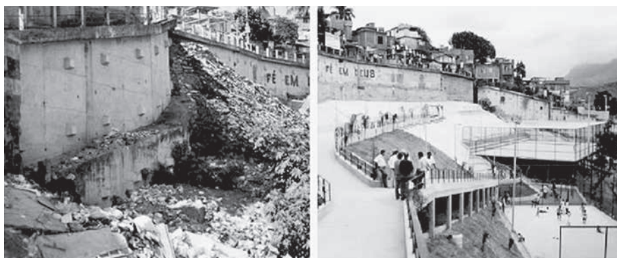
Figura 4. Recalificación estructural y servicios deportivos (ante y post operam). "Favela-Bairro", Rio de Janeiro (Brasil).

Históricamente a Latinoamérica se pone en primera fila en la dimensión del urbanismo informal y su difusión. Hoy en día se puede jactar de tener el mismo primado en términos de prácticas destinadas a componer un único organismo urbano, regularizando aquellos ámbitos nacidos bajo el signo de la ilegalidad. Agencias como el Banco Mundial, el Banco Interamericano de Desarrollo y UN-Hábitat han estado trabajando, durante decenios, para mejorar las condiciones habitacionales y socio-económicas en los asentamientos informales. Estas tentativas a gran escala implican una larga gama de partners - investigadores, financiadores, cooperadores, profesionales del ambiente urbano - no solo para proveer soporte crítico a las instituciones hacia políticas habitacionales dirigidas a las clases más vulnerables,