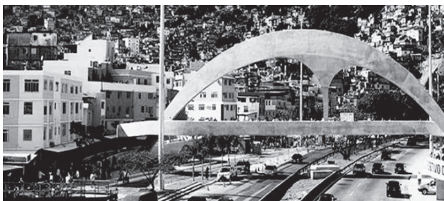
Figura 5. Infraestructura y a Rocinha "Favela-Bairro", Rio de Janeiro (Brasil).

sino también para ofrecer mejores competencias proyectuales frente a realidades que son difíciles de sanar. Intervenir en la ciudad informal significa enfrentarse con problemas sanitarios (alimentación, falta de agua y servicios higiénicos, alta mortalidad), económico-jurídicos (pobreza, criminalidad, accesibilidad a viviendas y terrenos), socio-culturales (desigualdades de género, explotación, analfabetismo), urbanos y ambientales (hacinamiento, migraciones, riesgos climáticos, falta de infraestructuras). En un marco urbano tan complejo, un gesto arquitectónico realmente eficaz requiere simplicidad y visión de totalidad. Con la escasez de medios se necesitan soluciones polivalentes que resuelvan simultáneamente más problemas en el corto y largo plazo.