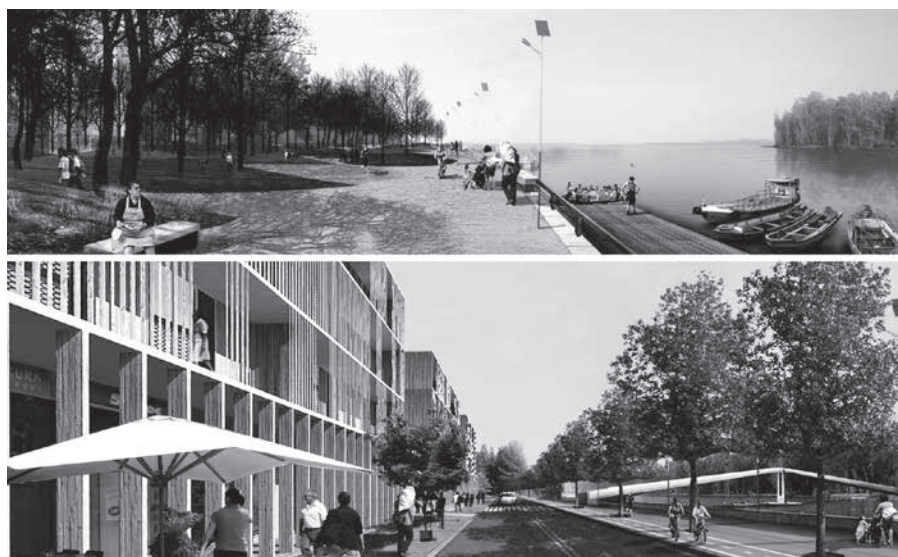
Figura 7. Sistemas de parques y espacios públicos para la recalificación de la costa, "PRES - Planificación Urbana Estratégica Resiliente", Elemental Arquitectos - Aravena, Constitución (Chile).

Partiendo por el análisis de los casos presentados anteriormente es posible replantear el perfil del arquitecto contemporáneo que opera en situaciones informales personificando una pluralidad de roles. No es un artista sino arquitecto-urbanista con una vocación que lo pone a servicio de la sociedad. Ahora no impone sus ideas desde arriba, sino que opera en terreno, conoce y respeta la ciudad informal para solventar las cuestiones físicas, sociales y ecológicas, sin imponer modelos extraños al contexto geo-cultural. En su calidad de técnico proporciona soluciones concretas, compartiendo experiencia y destreza científica para formar capital humano, produce elaboraciones y datos útiles. Sus competencias imponen la gestión de sujetos, tiempos y acciones diversas en el complejo proceso de mejoramiento de