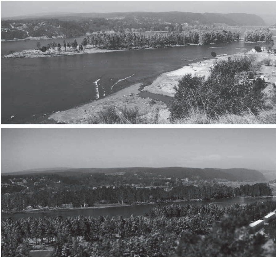
Figura 6. Reforestación de la costa como buffer zone contra las futuras inundaciones, “PRES - Planificación Urbana Estratégica Resiliente”, Elemental Arquitectos – Aravena, Constitución (Chile).

actores diversos (administración pública y la empresa EPM) por la reconversión de instalaciones hídricas abandonadas en parques y equipamientos lúdico-comerciales. Con un solo gesto han sido resueltos diversos problemas de seguridad, iluminación y cobertura hídrica en todos los barrios: se han multiplicado así las oportunidades de socializar (Hermelin Arboux, 2010).