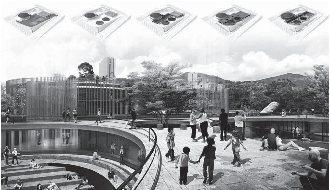
Figura 3. Estanques de agua como parque públicos, Medellín (Colombia).

se construyen barrios enteros. Aunque el término informal sea el atributo más usado para diferenciar la ciudad no planificada, hoy en día dicho término es rechazado porque implica una falta de forma que no pertenece a ninguna de otras expresiones conocidas. Como afirma Betaille, informal designa aquello que no tiene derechos de hacerse respetar, el elemento más débil del sistema dialectico formal/informal, donde lo visible existe gracias a al vacío que exalta el entorno construido y lo llena de significado. Más que de definiciones correctas, lo informal necesita de un reconocimiento oficial, como forma típica de asentamiento del siglo XX, emblema de una típica población proactiva que inicia procedimientos socio-económicos para lograr la autonomía negada por ser incompatible con las políticas habitacionales. La informalidad es la modalidad típica de urbanización metropolitana de Iberoamérica (Roy, 2005) en donde representa el fenómeno social más significativo del siglo XX. En las mismas décadas, la urbanización masiva conforma las grandes capitales de Europa y América, pero las diferencias sustanciales con Latinoamérica radican