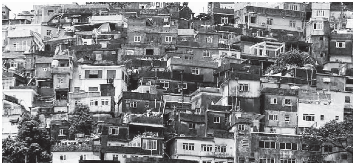
Figura 1. Favelascape, A. Eflon.