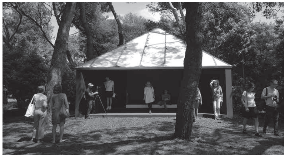
Capilla Vaticana de Andrew Berman.

Las instalaciones en los Giardini de la Bienal tienen, como siempre, un marcado carácter de autor, ofreciendo un amplio panorama, desde los grandes temas sociológicos y ambientales hasta los