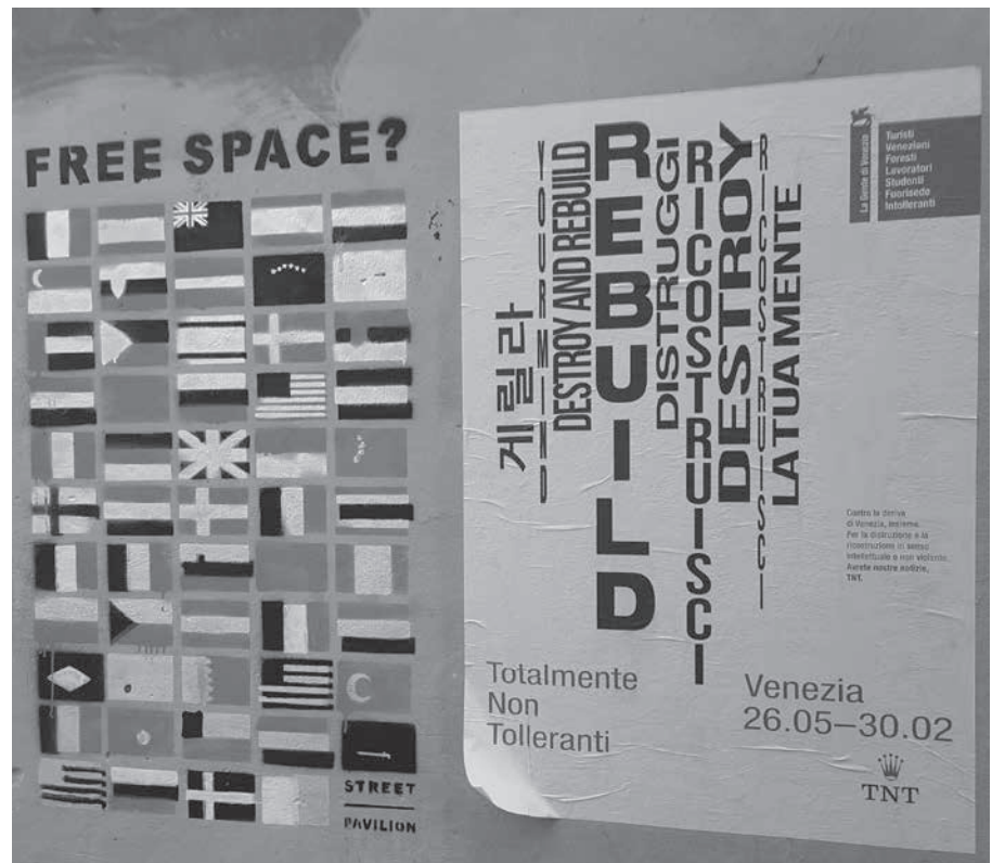
Cartel Bienal 2018.