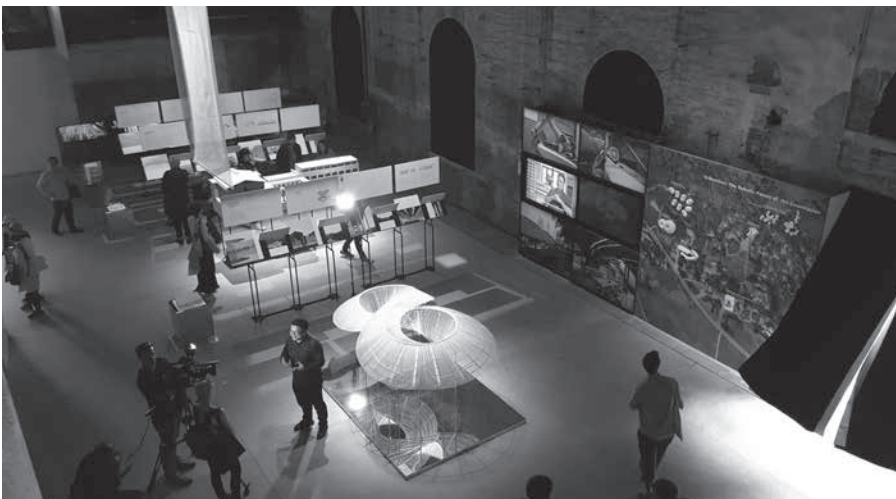
Pabellón de China.

La Strada Novissima (calle nuevísima) que ponía al centro de la nueva ciudad la calle-corredor, detestada por Le Corbusier y el Movimiento Moderno. O es posible hipotetizar otros escenarios, no menos importantes para transformar la bienal en una muestra fantasmagórica, sin inhibición de coherencia cultural, o lo que es lo mismo en un encuentro de desencuentros de puntos de vista distintos, pero reagrupados según un orden mínimo, y tal vez, trazando alguna genealogía. En resumen, todo esto es mejor que las propuestas de Grafton , que pareciera que no sabe lo que hace, y tiene, por lo demás, la pretensión de adjuntar a cada instalación un comentario de ellas.