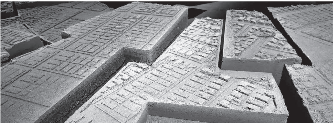
Pabellón de Chile. Detalle modelo en tierra apisonada.