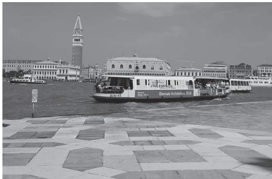
Venecia desde la isla de San Giorgio.